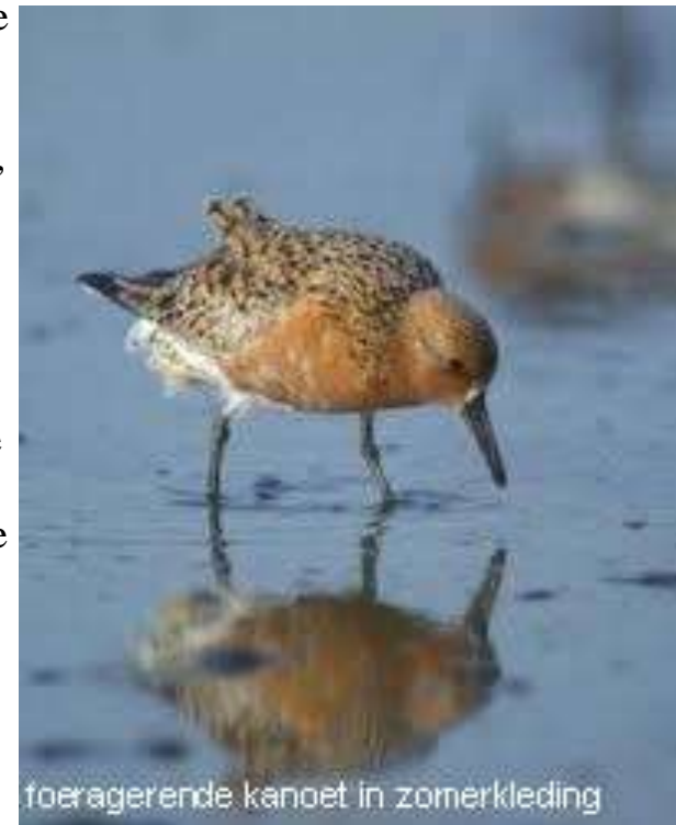
foeragerende kanoet in zomerkleding

Het voedselbiotoop bestaat uit zandige of slikkige getijdenplaten. De kanoeten vormen bij het foerageren grote compacte groepen die in één getijdencyclus een groot oppervlak aan wadplaten afzoeken. Omdat hij zich gespecialiseerd heeft in kleine tweekleppigen is de kanoet min of meer gebonden aan getijdenplaten met grote dichtheden aan schelpdieren, vooral nonnetjes, in de bovenste bodemlaag. Omdat kanoeten de schelpdieren in hun geheel doorslikken, mogen de te eten prooien niet groter (tot 2 cm) zijn dan zijn bek hem toestaat. Kanoeten concentreren zich meestal in enkele grote groepen op specifieke rustlocaties: permanent droge, kale hooggelegen zandplaten.