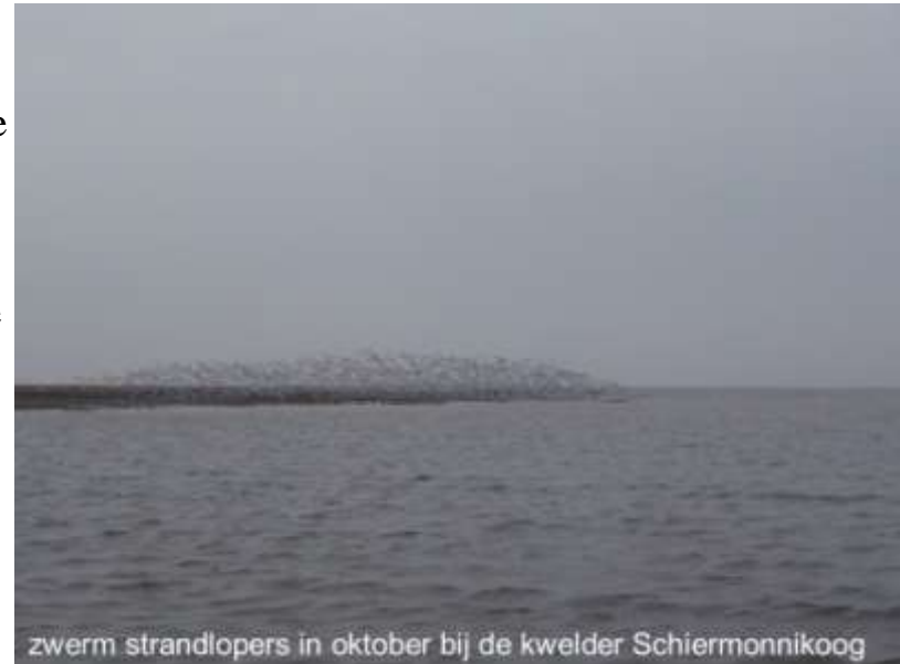
zwerm strandlopers in oktober bij de kwelder Schiermonnikoog

Tijdens hoogwater gaat de soort soms door met voedsel zoeken op hooggelegen delen van de getijdenplaten, aan de kwelder- of dijkrand of op drassige plaatsen binnendijks. De bonte strandlopers gebruiken doorgaans kwelders, zand- en modderbanken, stranden en inlagen als gezamenlijke hoogwater-vluchtplaatsen en deelt die plaatsen vaak met andere vogelsoorten.