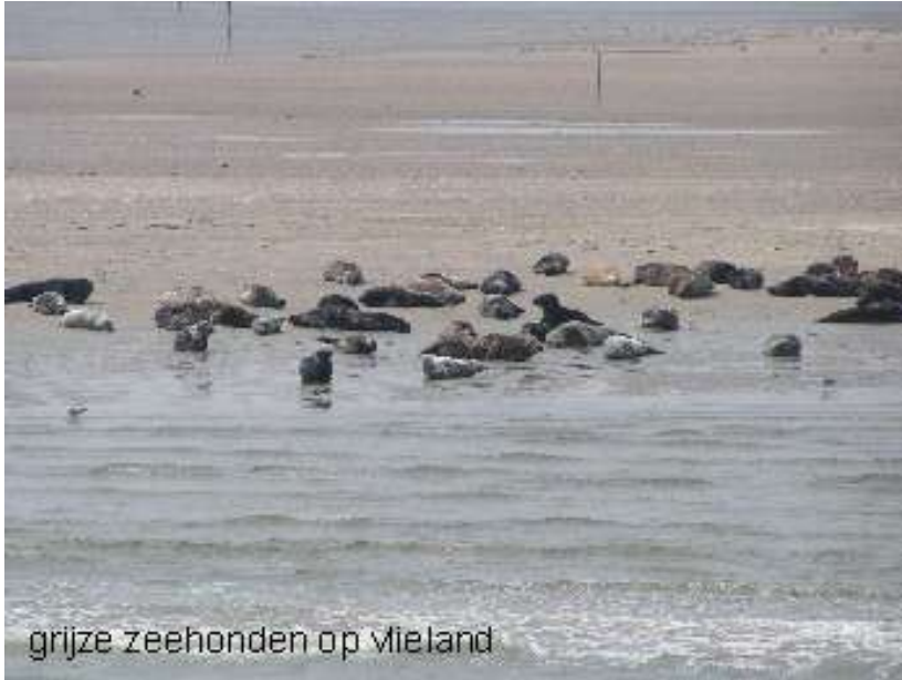
grijze zeehonden op Vlieland

De grijze zeehond leeft en foerageert vooral op open zee. De Waddenzee is belangrijk voor ligplaatsen en niet of nauwelijks als foerageergebied. Voor de voortplanting is het dier afhankelijk van permanent droogvallende platen, stranden en duinen. In de Nederlandse wateren worden pups geboren van december tot februari. In maart en april verharen de zeehonden. Gedurende de eerste twee weken na de geboorte kunnen jonge grijze zeehonden niet zwemmen en na het spenen blijven de jongen nog een aantal dagen op de kant voordat ze zelfstandig op jacht gaan.