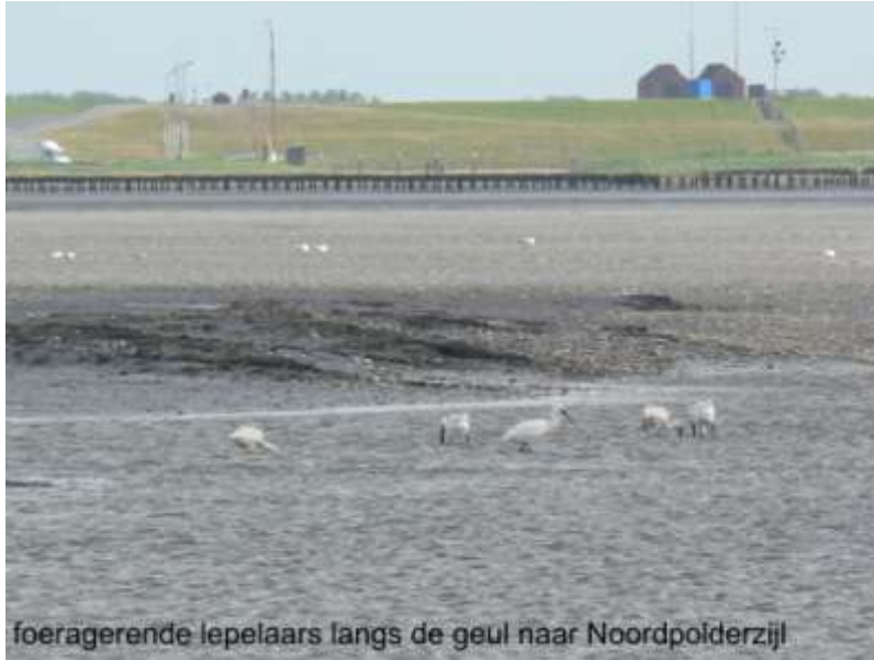
foeragerende lepeelaars langs de geul naar Noordpolderzijl

Lepelaars zijn op steeds meer plekken op de waddeneilanden gaan broeden, alleen op Griend en enkele zandplaten broeden de lepeelaars niet. De vogels leven van kleine visjes en garnalen die ze tot op 40 km afstand van de broedkolonie zoeken. Ook op Balgzand en ten oosten van Den Oever liggen broedkolonies. Lepelaars broeden van half april tot juli.