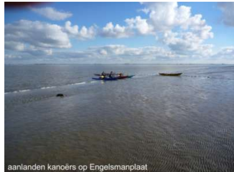
aanlanden kanoërs op Engelsmanplaat

verstoring van broedende vogels en zogende zeehonden uit den boze is en een nadelig effect heeft op de overlevingskansen van die dieren. Als vogels hun nesten of jongen moeten verlaten neemt de kans toe dat meeuwen, kraaien en roofvogels toeslaan. Maar menselijke verstoring is slechts één van de factoren die het broedsucces beïnvloeden; naast negatieve menselijke activiteiten zijn voedselaanbod, roofdieren, ziektes, kou, slecht weer en overspoelen bij extra hoog tij natuurlijke factoren die het aantal volwassen nakomelingen negatief kunnen beïnvloeden. Daarnaast hebben ook de gevaren die de