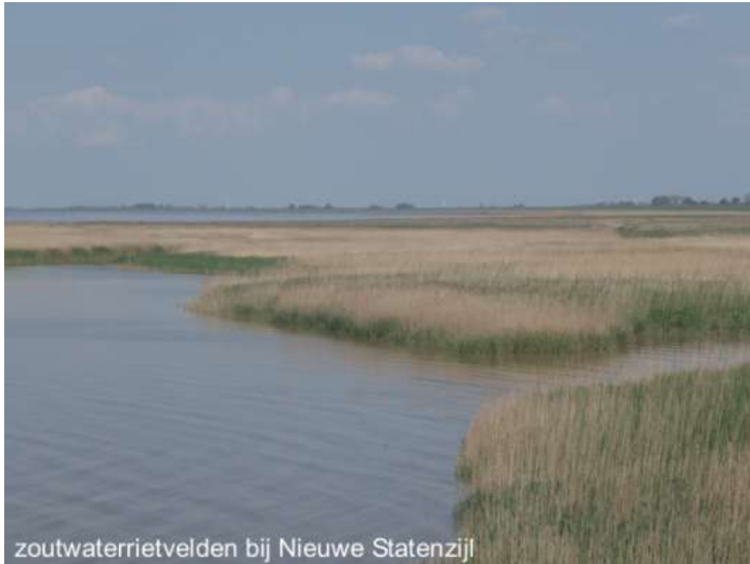
zoutwaterrietvelden bij Nieuwe Statenzijl

29. Boschwad en Horsbornzand: Het hele gebied is samen met Rottumeroog, Rottumerplaat, Boschplaat en Zuiderduintjes (zie nr 28) belangrijk voor vogels als foerageergebied gedurende vrijwel het hele jaar. Tijdens de trek verzamelen zich in dit gebied grote aantallen vogels. Voor zeehonden is het een belangrijk zoog- en foerageergebied. Het gebied is niet toegankelijk van 15/5-1/9.