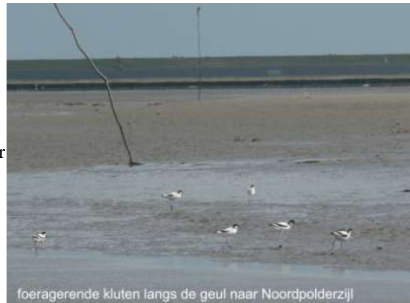
foeragerende kluten langs de geul naar Noordpolderzijl

De meeste kluten trekken 's winters weg naar het zuiden. In december-februari worden in ons land weinig kluten gezien. Nederland vervult tijdens de trektijd een belangrijke functie als pleisterplaats voor kluten. Deze trek vindt vooral plaats in augustus-november en maart-april. Het voorkomen van doortrekkers, nazomerpleisteraars (inclusief ruiende vogels) en overwinteraars van de kluut is gebonden aan getijdengebieden en in mindere mate aan grote moerasgebieden als de Oostvaardersplassen. De hoogste aantallen worden bij Noord-Friesland buitendijks en in de Dollard waargenomen. De vogels