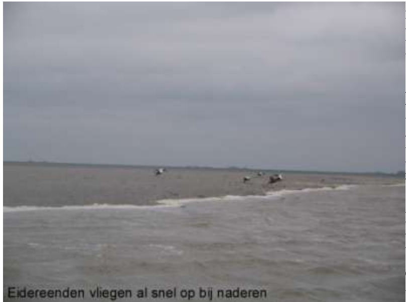
Eidereenden vliegen al snel op bij naderen

Bescherming: Omdat de jongen van de grijze zeehond op de plaat blijven is de kans dat moeder en jong elkaar kwijt raken veel kleiner dan bij de gewone zeehond. Bovendien worden de jongen in de winterperiode geboren, waardoor de kans op verstoring sowieso kleiner is. Maar verder geldt ook voor de grijze zeehond dat een verstoring tijdens het zogen verlies van een zoogbeurt betekent.