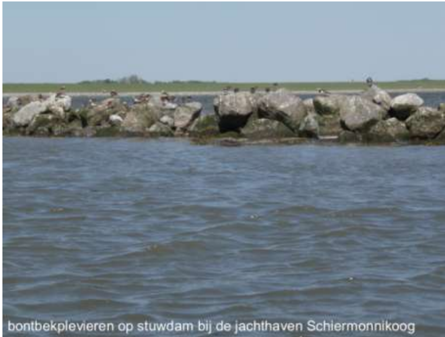
bontbekplevieren op stuwdam bij de jachthaven Schiermonnikoog

Kluten zoeken bij voorkeur voedsel, zoals kleine kreeftachtigen, insecten en wormen, op slijkige platen en langs geulranden. In de ruitijd verzamelen de kluten zich op slibrijke platen zoals die voorkomen in de kwelderwerken en in de Dollard, of in grote ondiepe, vaak beschutte wateren. De rustbiotoop bestaat uit ondiep water. In getijdengebieden bepalen eb- en vloedritme de dagindeling, de vogels 'overtijen' dan op hoogwatervluchtplaatsen. Buitendijks rusten kluten tijdens de hoogwaterperioden vooral in grote groepen langs randen van kwelders.